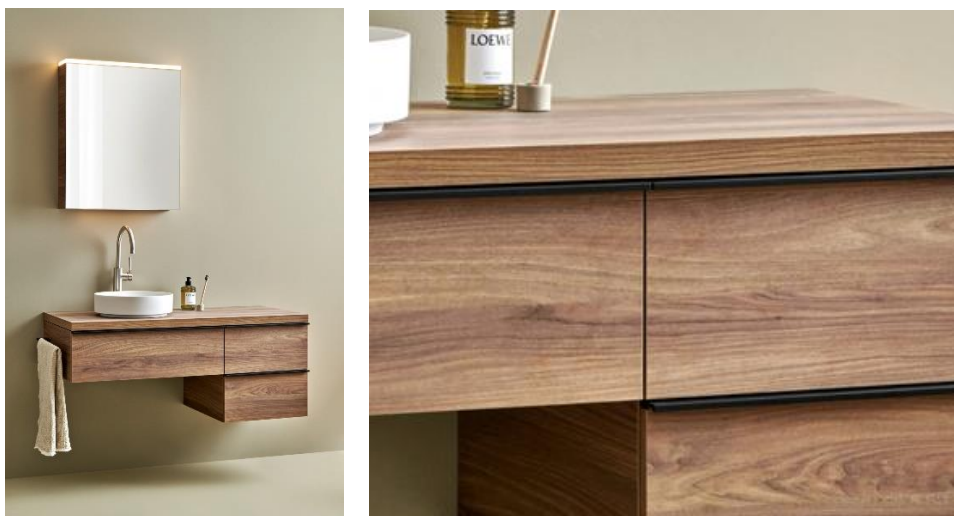
Durchlaufende Holzmaserung im Frontbild - Serie IVA

Das Frontbild ist ein essenzieller Bestandteil der Gesamtästhetik von Badmöbeln. Die Fraefel AG setzt deshalb auf eine neue Software, um bei mehreren nebeneinander eingesetzten Schubladenfronten eine durchgängige Plattenstruktur oder Maserung zu gewährleisten. Eingesetzt wird die neue Technik bereits bei mehreren Badmöbelserien, beispielsweise bei «Schweizerbad IVA» mit durchlaufender Holzmaserung in ulme sangallo.